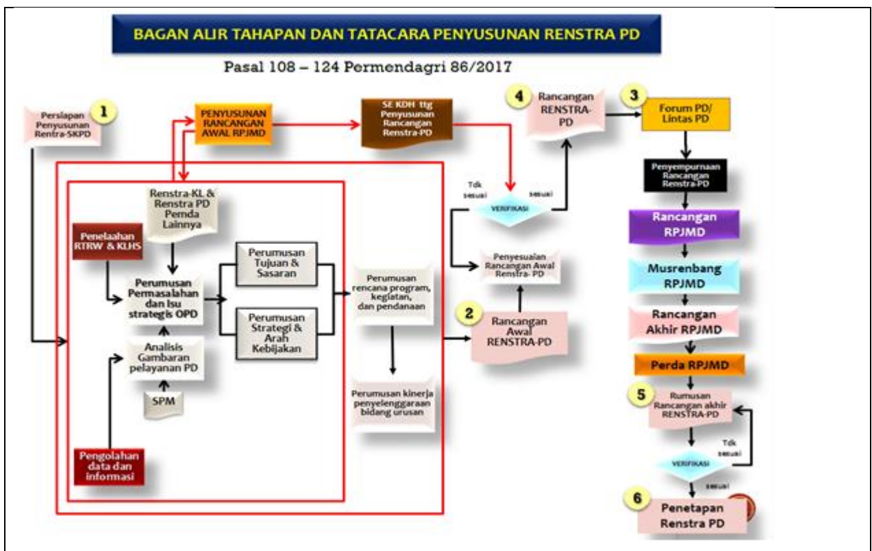
Gambar 1. 1 Proses Penyusunan Renstra Perangkat Daerah