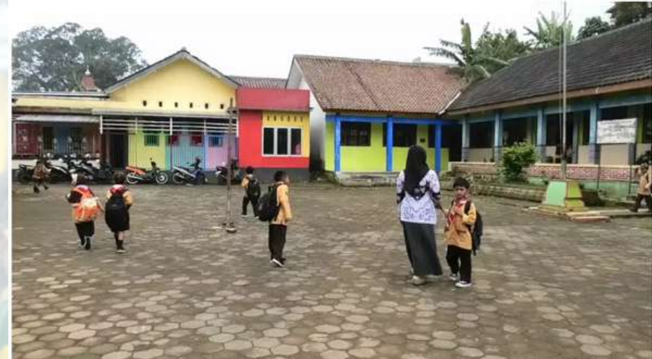
Teror tawon terjadi di Sekolah Dasar Negeri 1 Wonotirto, Kecamatan Bulu, Temanggung, Jawa Tengah, Sabtu 30 Maret 2024.

Temanggung, Beritasatu.com - Puluhan siswa sekolah dasar (SD) di Temanggung, Jawa Tengah, mengalami serangan ribuan tawon jenis siring. Pihak sekolah berkoordinasi dengan petugas Damkar Temanggung melakukan operasi tangkap tawon (OTT).