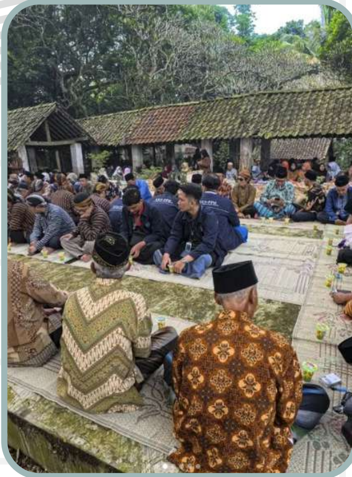
DINBUDPAR Sadranan di makan Suroloyo, Soropadan 3.391 likes 3 komentar