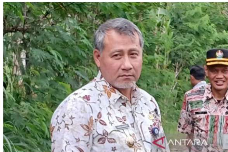
Penjabat Bupati Temanggung Hery Agung Prabowo.

Temanggung (ANTARA) - Pemerintah Kabupaten Temanggung, Jawa Tengah, pada tahun 2024 ini membuka rekrutmen sesuai kebutuhan 453 calon aparatur sipil negara (ASN) baik melalui penerimaan calon pegawai negeri sipil (CPNS) dan pegawai pemerintah dengan perjanjian kerja (PPPK).