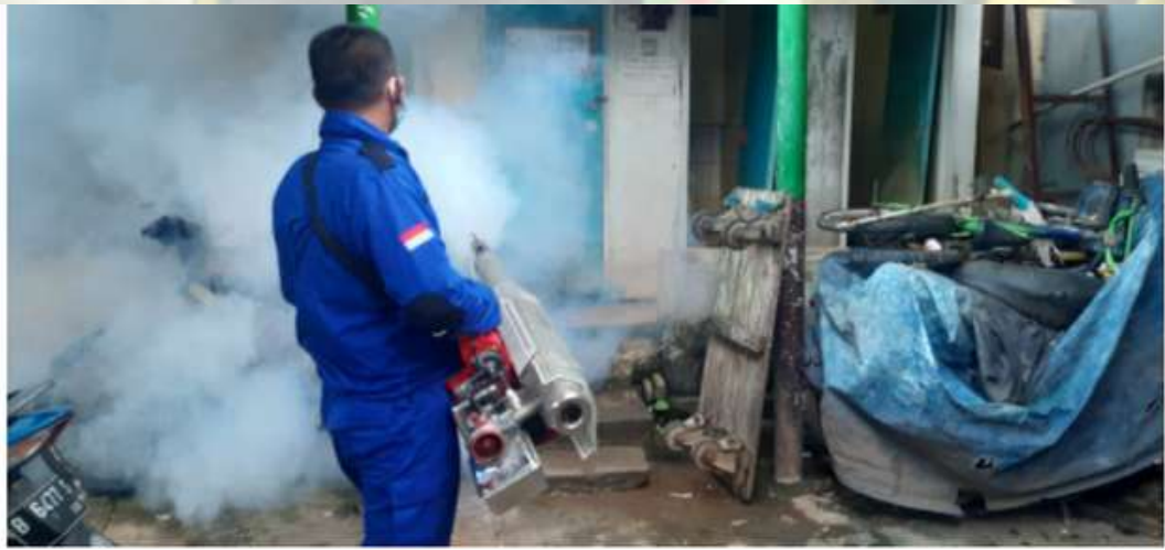
Ilustrasi--Pemberantasan sarang nyamuk dengan fogging. (Medcom.id)