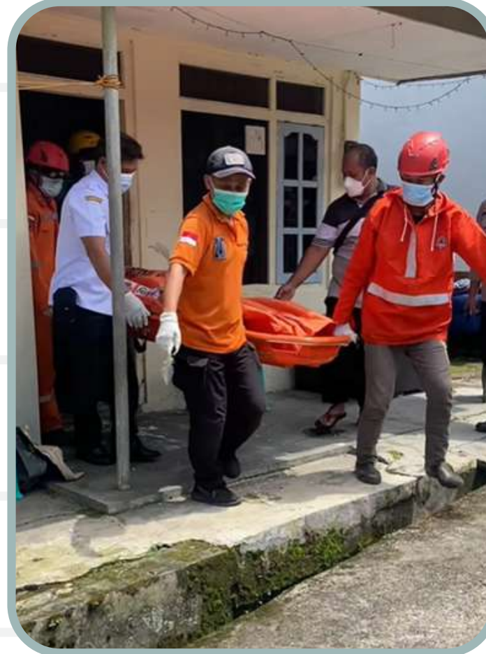
BPBD Evakuasi jenazah sebatang kara di Kebonsari 1.950 likes 31 komentar