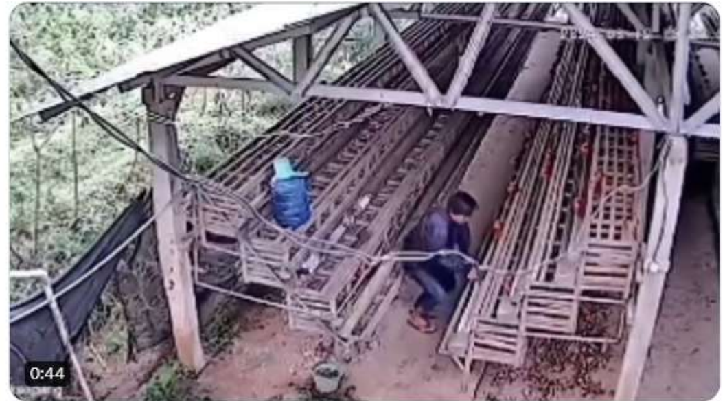
8:05 AM · Mar 31, 2024 · 9,762 Views

Via: @kabarnegri #elshintaviral Translate post