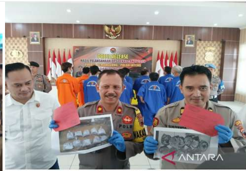
Polres Temanggung menyita 21 kilogram bubuk petasan dari dua pengedar.