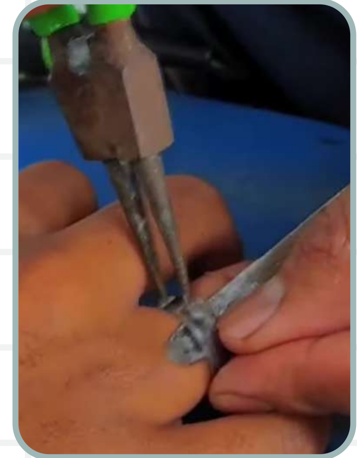
SATPOL PP DAMKAR Evakuasi potong cincin Mahfud Hedi 1.646 likes 63 komentar