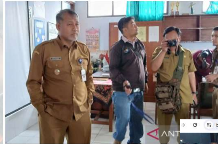
Penjabat Bupati Hary Agung Prabowo meninjau gedung SDN 1 Jampiroso, Kecamatan Temanggung.

Temanggung (ANTARA) - Penjabat Bupati Temanggung Jawa Tengah Hary Agung Prabowo gedung sekolah dasar (SD) yang mengalami kerusakan dan dapat membahayakan keselamatan siswa di wilayah setempat mendapatkan prioritas utama untuk diperbaiki pada 2025.