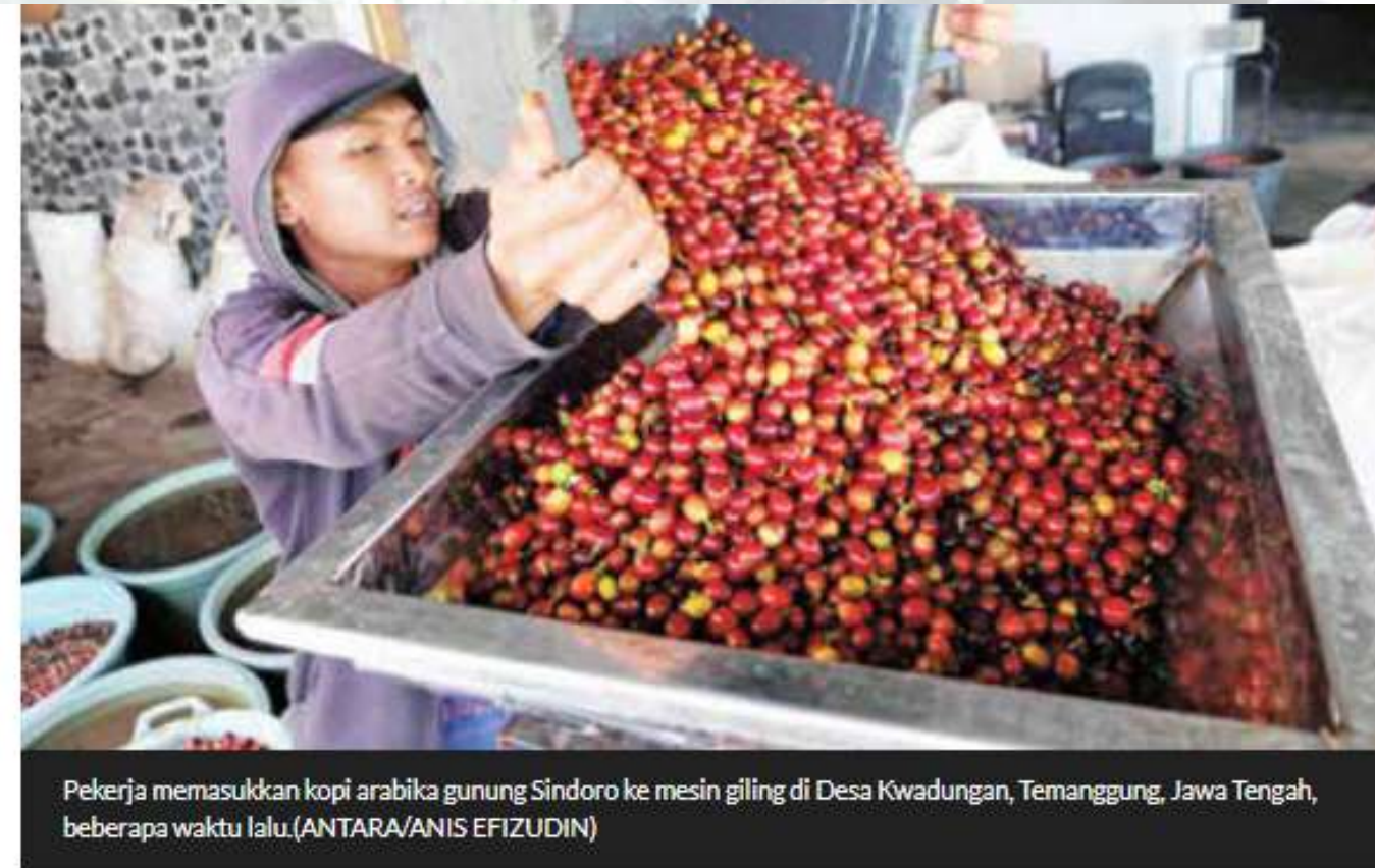
Pekerja memasukkan kopi arabika gunung Sindoro ke mesin giling di Desa Kwadungan, Temanggung, Jawa Tengah, beberapa waktu lalu.

PENELITI Ahli Utama di Badan Riset dan Inovasi Nasional (BRIN) Delima Hasri Azahari mengungkapkan konsumsi kopi spesial di Indonesia masih rendah jika dibandingkan dengan kopi komersial. Sejauh ini, masyarakat lebih mengenal kopi saset yang harganya terjangkau ketimbang kopi spesial dengan harga berkali-kali lipat dari kopi saset.